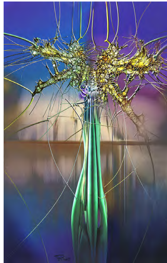
Radu-Anton Maier acrilic pe pânză 93 x 59 cm,

De-a lungul istoriei, procesul deșărădăcinării și al înrădăcinării a generat în mod repetat forme mixte de culturi, dar a adus și schimbări sau combinații ale căror variațiuni sunt rezultatul unui proces cultural constant. Seria artistică a rădăcinilor conține simbioza deplină a procesului deșărădăcinării și înrădăcinării, stare trăită intens și la propriu de către autor. Primul contact cu picturile lui Radu-Anton